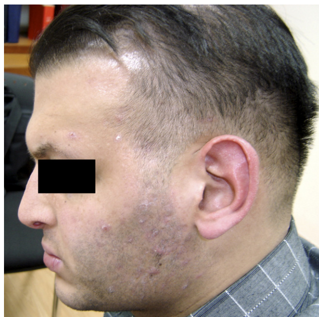
Figure 1. Cheveux fins et clairsemés, sourcils peu abondants, front bombé, lèvres épaisses et protubérantes chez le patient âgé de 23 ans.

Les dysplasies ectodermiques constituent un groupe large et hétérogène de maladies présentes dans plus de 150 syn-