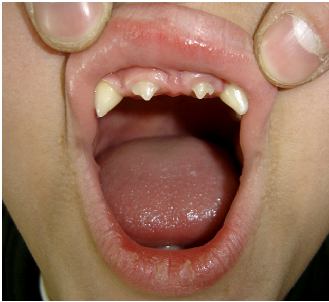
Figure 2. Eruption dentaire conique et incomplète chez son frère âgé de sept ans, également atteint de dysplasie ectodermique anhidrotique.

dromes distincts. Plusieurs classifications ont été proposées. La première est établie en fonction de la présence ou non de quatre signes cardinaux : la trichodysplasie, les anomalies dentaires, l'onchodysplasie et les troubles de la sudation. Avec l'identification progressive des gènes en cause, de nouvelles classifications clinicogénétiques et physiopathologiques ont permis de répartir les dysplasies ectodermiques selon le déficit cellulaire structurel ou fonctionnel en cause [2–4].