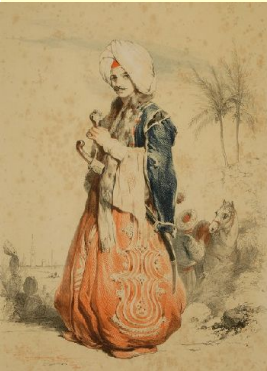
Léon de Laborde dans son costume de voyage

Léon de Laborde est né à Paris le 15 juin 1807. Il était le fils du comte Alexandre de Laborde, haut fonctionnaire de l'Empire puis député libéral sous la Restauration et la Monarchie de Juillet, passionné de beaux-arts et de voyages dont il fit plusieurs relations illustrées.