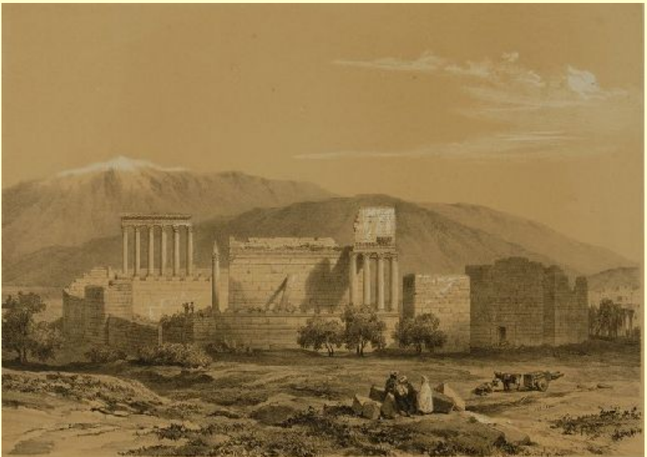
Baalbeck : Vue générale de la Ville - Léon de Laborde : Voyage en Orient... , Paris : Firmin Didot, 1837