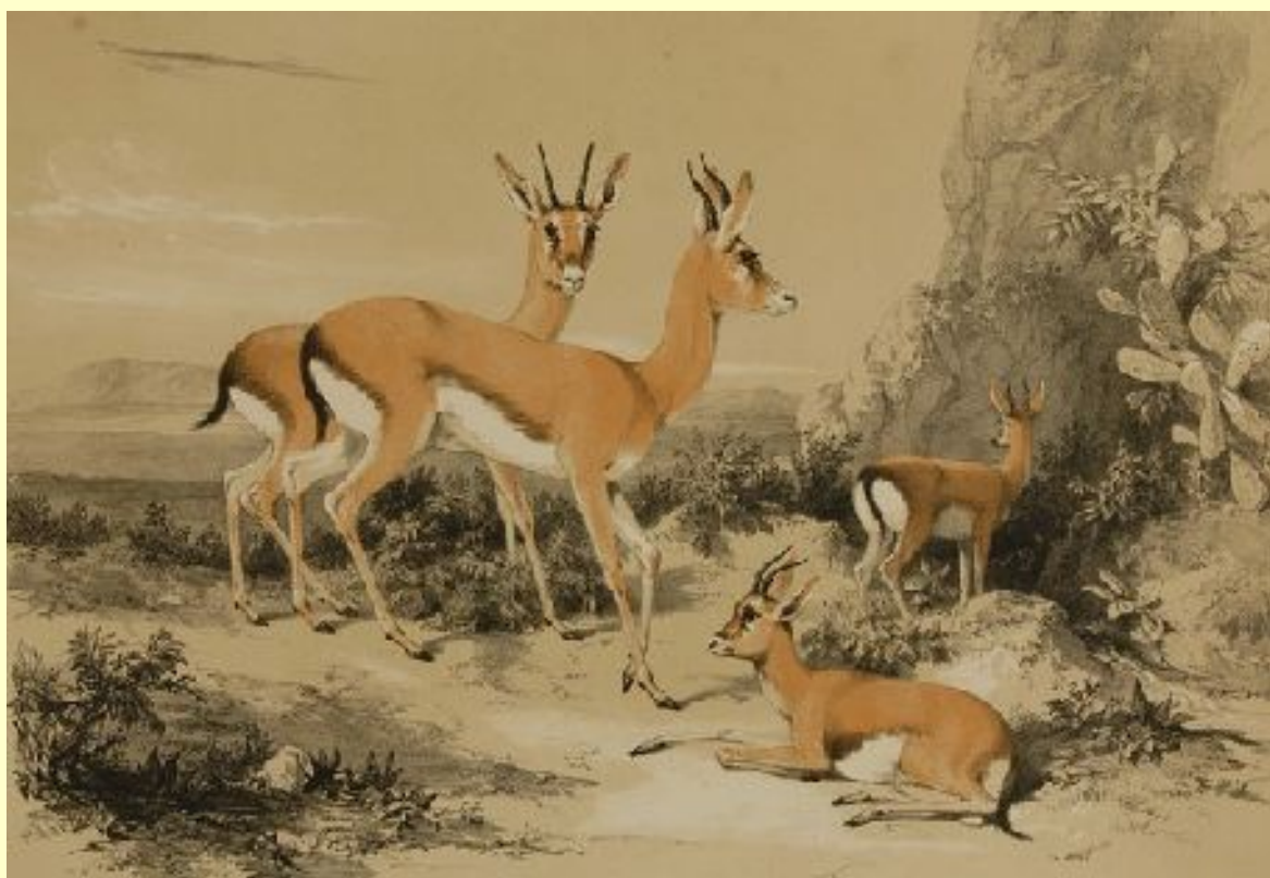
ALEP : Gazelles du désert près d'une source - Léon de Laborde : Voyage en Orient... , Paris : Firmin Didot, 1837