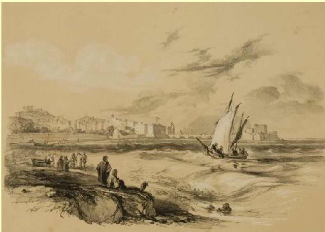
SIDON : Vue générale de la ville - Léon de Laborde : Voyage en Orient... , Paris : Firmin Didot, 1837

Environ la moitié des presque deux cents dessins du Voyage de la Syrie a été réalisée sur le terrain par Léon de Laborde.